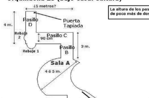
Calle Bisbe Urquinaona

Reconstrucción muy aproximada (de memoria y sin haber tomado medidas), del plano del Refugio de la C/ Bisbe Urquinaona 25 (bajo Casal Cultura)